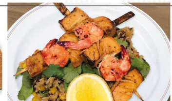
Брошеты из лосося и креветок