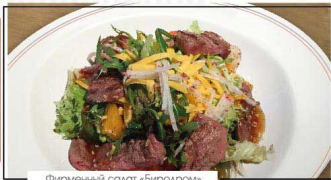
Фирменный салат «Биродром»