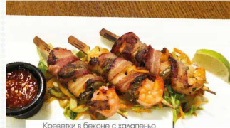
Креветки в беконе с халапеньо