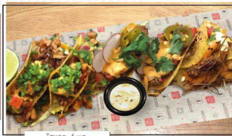
Такос, 6 шт.